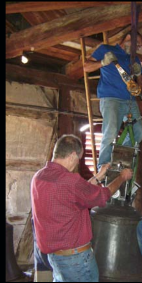
Am Dienstag, dem 20. September 2011, kehrten Osanna und die Evangelistenglocke wieder