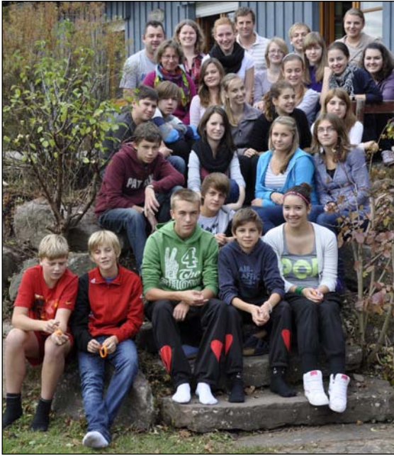
Konfirmandenfreizeit in Breitenberg